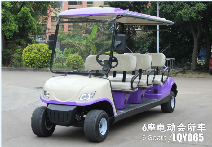
6座电动会所车 6 Seats / LQY065