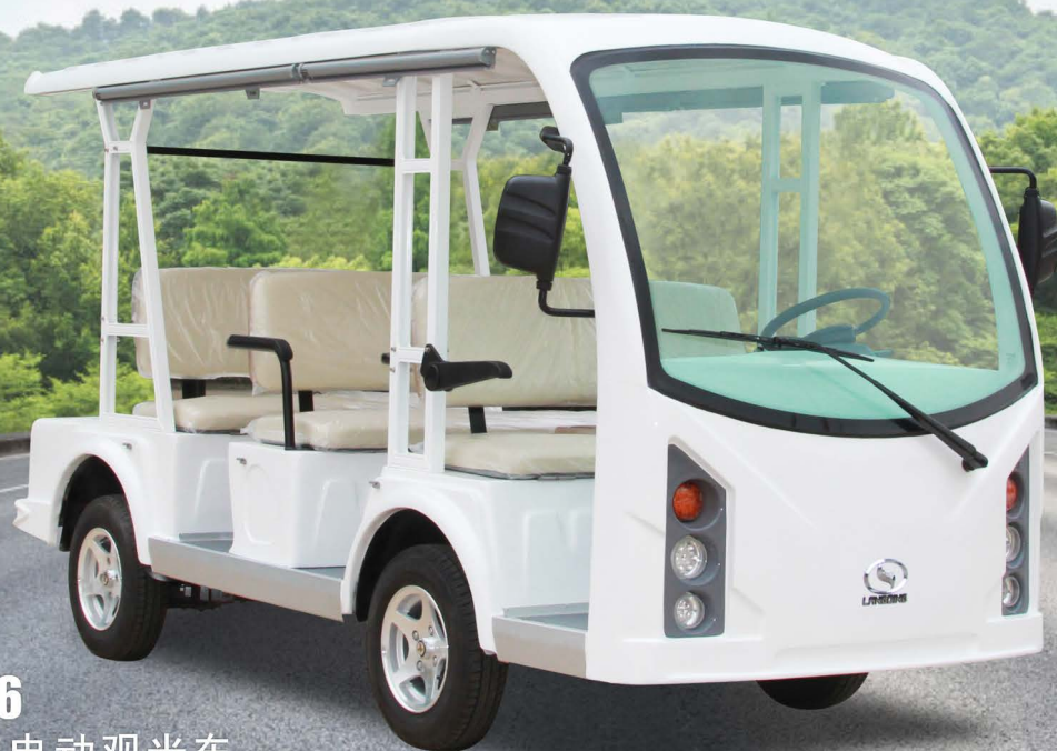
LQY086 新型8座电动观光车 8 Seats Tourist Coach