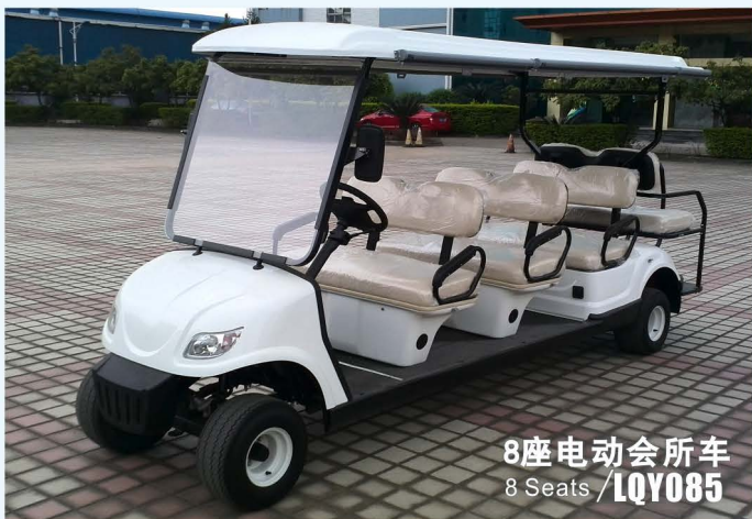
8座电动会所车 8 Seats / LQY085