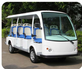
公交座椅 (选配), 前护杠 (选配)