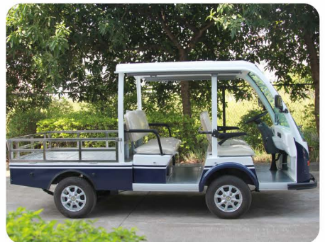
双排座半顶款(选配)