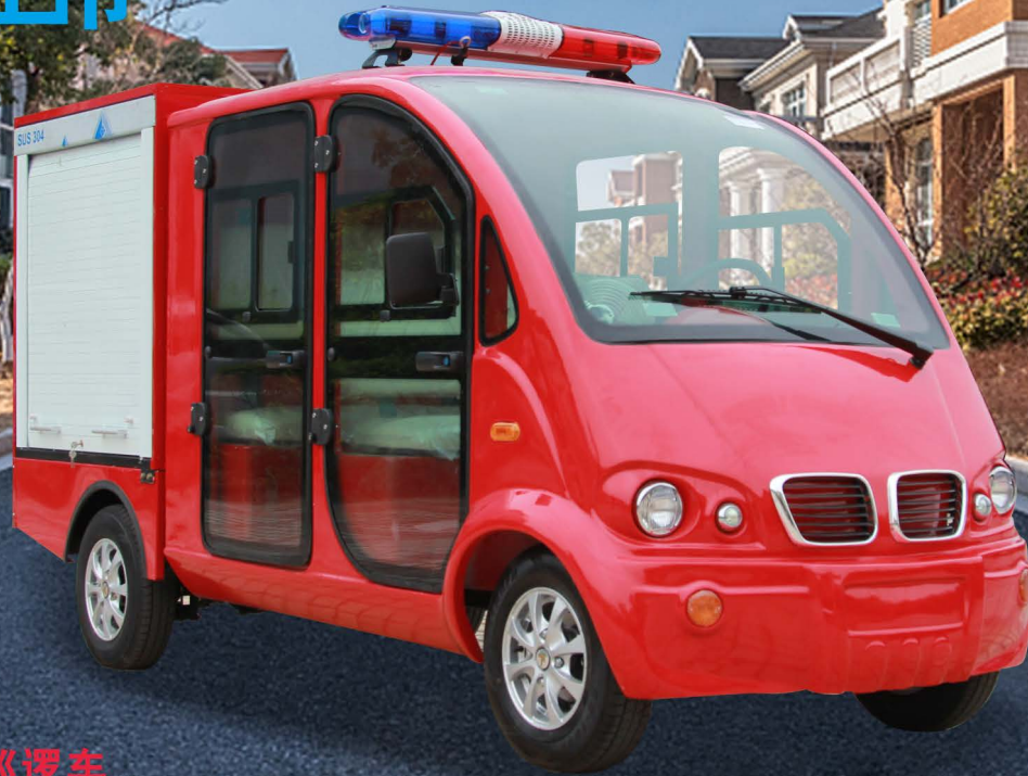
LQXF051 电动消防巡逻车 Electric fire patrol car