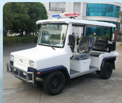
黑色皮革座椅（标准款）