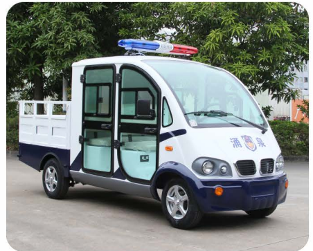
带门双排座巡逻载货车