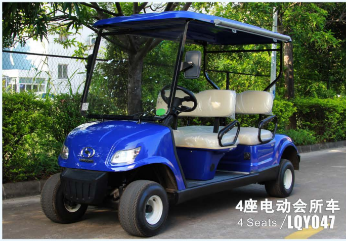
4座电动会所车 4 Seats / LQY047