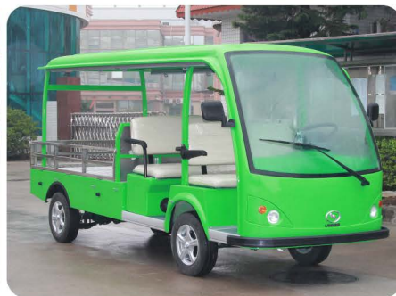
全顶双排座款 (定制)