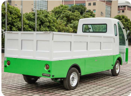
标准色：丰田白，订制：绿白