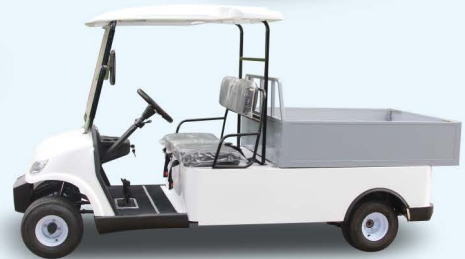
多功能车 | LQF047 Utility Car