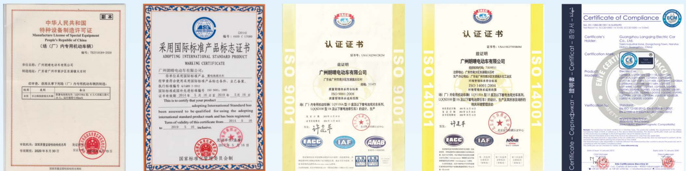
特种设备制造许可证 采用国际标准产品标志证书 质量管理体系认证 环境管理体系认证 欧洲CE认证