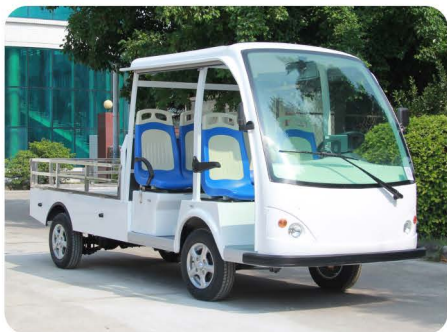
双排座公交座椅款