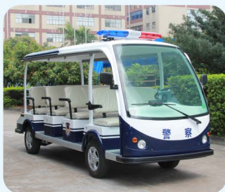
可安装警灯(车身分色方案)