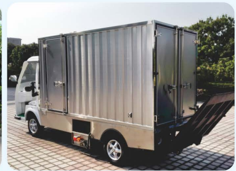
不锈钢货箱+升降尾板（定制）