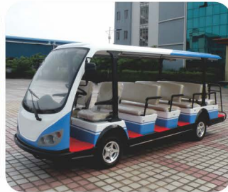
车身分色方案（可指定颜色）