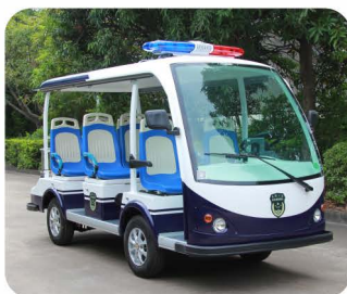
车身分色方案 (可指定颜色)