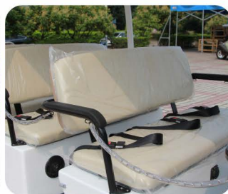
可定制安装安全链和安全带(选配)