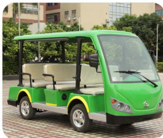
车身分色方案（可指定颜色）