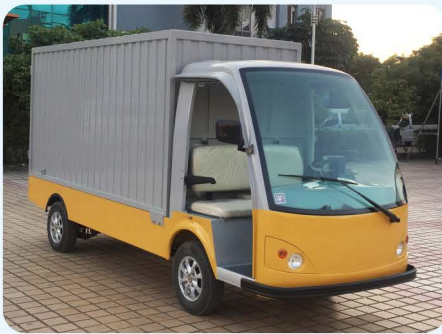
车身分色方案（可指定颜色）