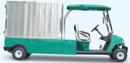
多功能车 | LQF065 Utility Car