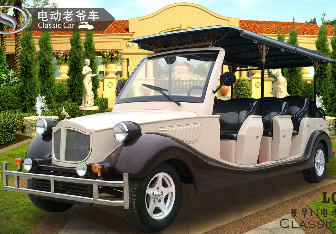
LQL111 豪华11座电动老爷车 CLASSIC CAR