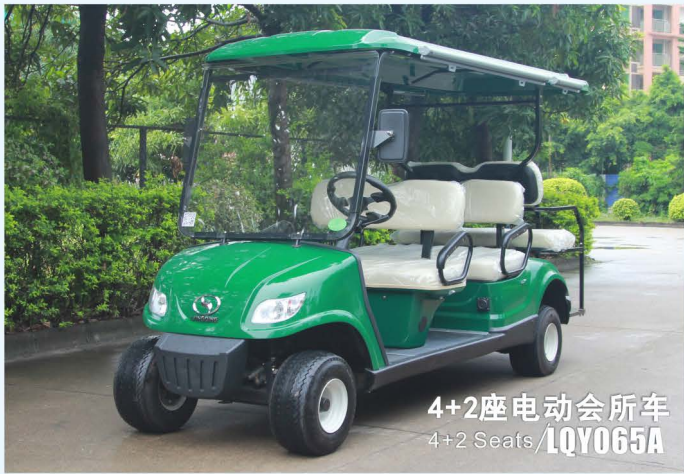
4+2座电动会所车 4+2 Seats / LQY065A