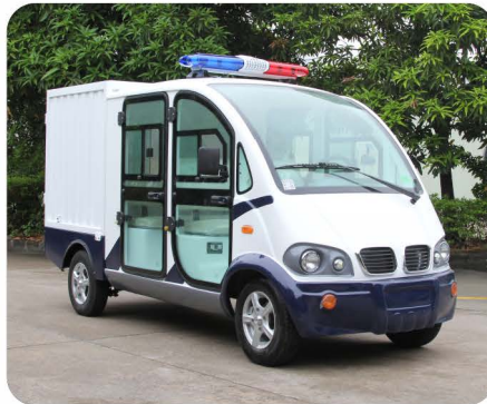
带门双排座箱式巡逻载货车