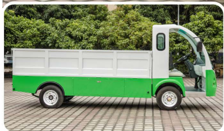
新型厢式电动货车/LQF122M