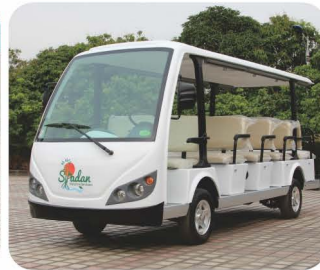
车身标准色（丰田白）