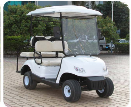
2座电动高尔夫球车