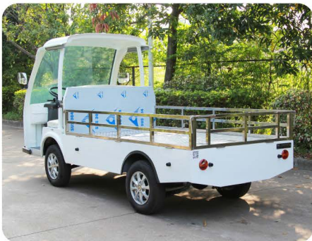
车身标准色(丰田白)