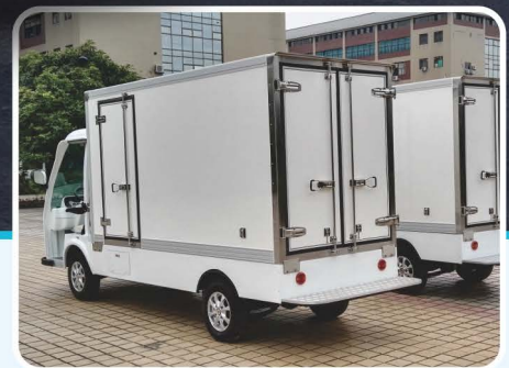
复合材料货箱+车尾后踏板（定制）