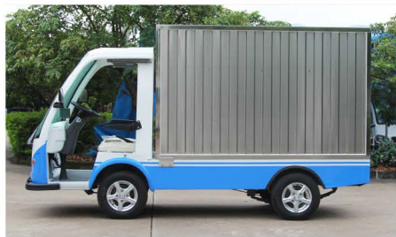
不锈钢货箱+更多车身颜色(可指定)