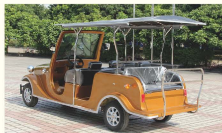
经典8座电动老爷车/LQL082