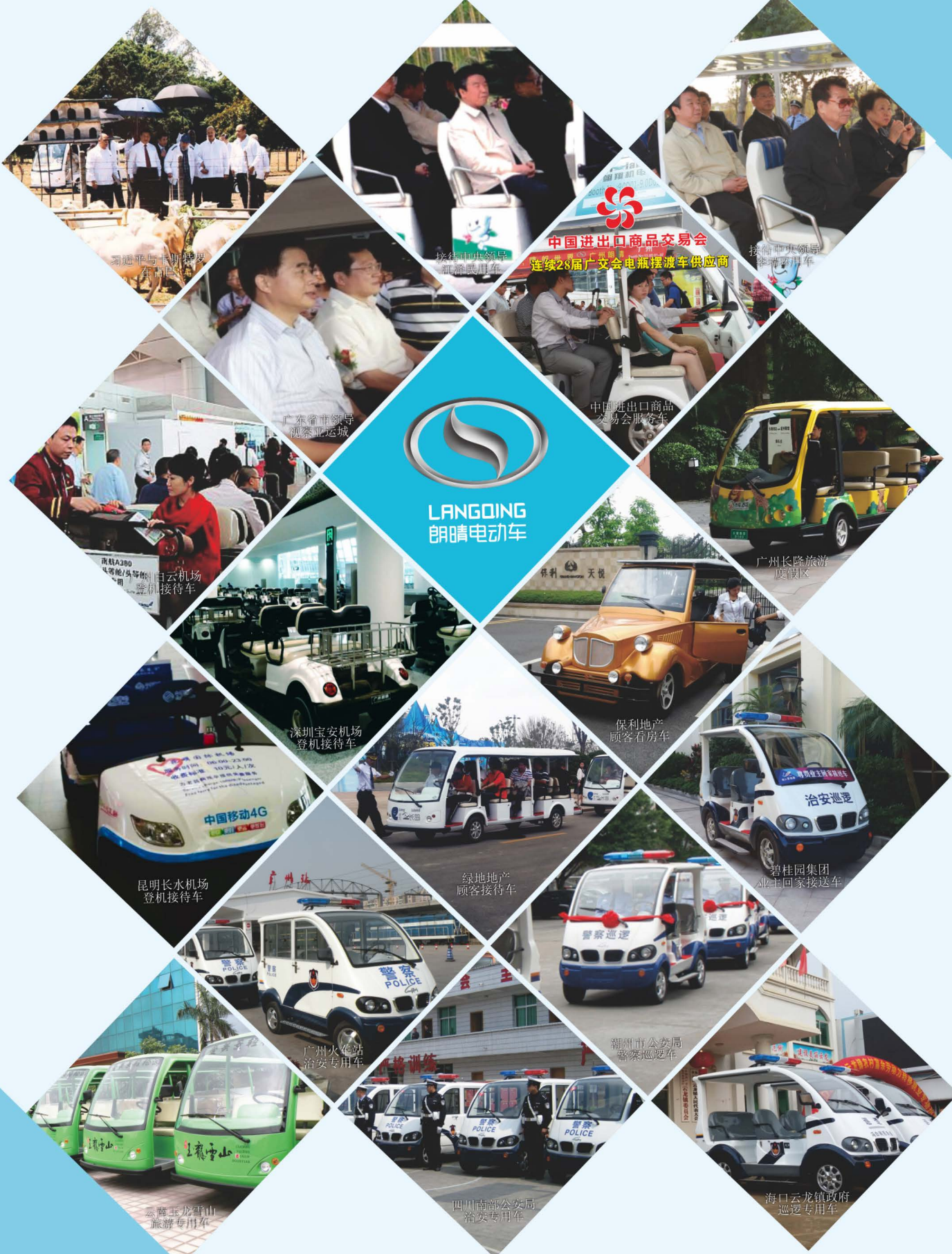
习近平与卡斯特罗在吉隆坡