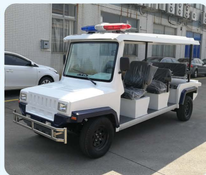
公安蓝白色款(可安装警灯)