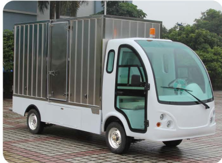
驾驶室封闭门+不锈钢货箱+侧开门+车尾后踏板（定制）