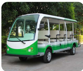
车身分色方案 (可指定颜色)